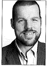
Tjerk de Reus is literatuurcriticus voor cv-koers en het Friesch Dagblad . Meer recensies vind je op tjerkdereus.nl .

'Dorsvloer vol confetti' krijgt - terecht - veel aandacht. Dit is geen afrekening, maar een liefdevolle bespiegeling .